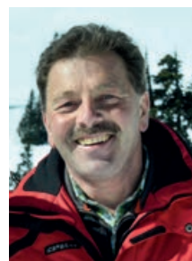
Johann Abuja Naturpark Ranger, Natur-Aktiv-Guide

Bei der „unplugged-Tour“ werden Sie von einem spezialisierten Natur-Aktiv-Guide begleitet.